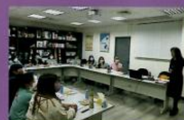
教育訓練-主管共講堂