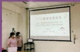
產學合作-實習成果發表

累積豐富的長照實務經驗，建構完善的作業制度與規範。擔任管理顧問一職，協助與輔導團隊辦理長照相關服務，包括：日照中心設立與經營、失智據點運作、居家長照機構設立與經營、個案管理評鑑等。