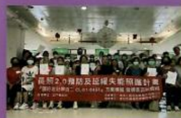
活動帶領-預防及延緩失能課程組回訓

重視人才培育，每年辦理多元的課程，包括預防及延緩失能課程、自立支援課程、長照復能課程、照顧服務繼續教育訓練等課程。另每月辦理跨專業個案討論，邀請不同專業夥伴進行個案研討。