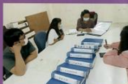
管理顧問-個案輔導