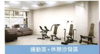
運動區+休憩沙發區